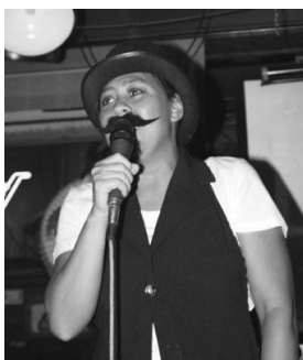
Een prachtige impersonatie van Dorus mocht op de snorrenborrel natuurlijk niet ontbreken!

Het was een drukte van belang in Para-Normaal Speciaal Bier Cafe Odeon tijdens de snorrenborrel, en de spanning steeg tot een ongekende hoogte tijdens het onthullen van het kado ter gelegenheid van het 25 jarig jubileum.