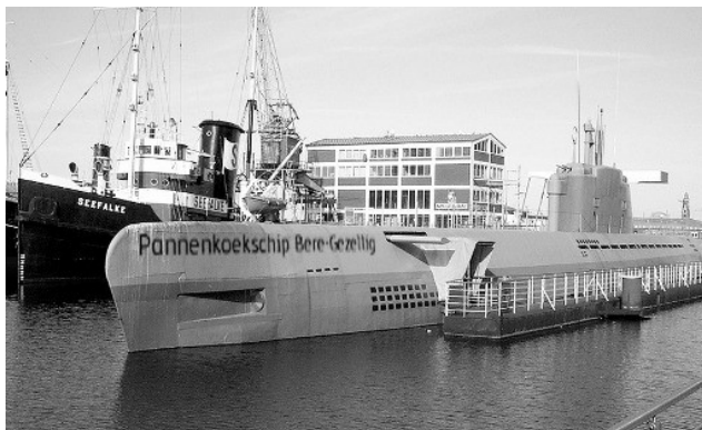
Pannenkoekenschip Bere-Gezellig, hier nog aan de Schermerringvaart.

Er wordt vermoed dat na dit debacle het schip het ruime sop heeft gekozen om eventuele schadeclaims en een bezoek van Keuringsdienst Van Waren te ontlopen. Het schip is voor het laatst afgelopen woensdag nog gesignaleerd bij Harlingen, maar daarna lijkt het van de aardbodem verdwenen te zijn.